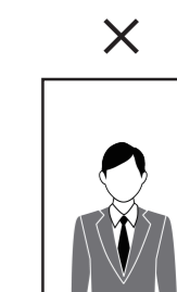
不適当な写真の例 (遠すぎ、近すぎるもの)